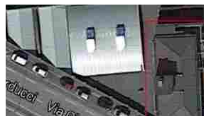
Appartamenti Sesto San Giovanni Ferraris